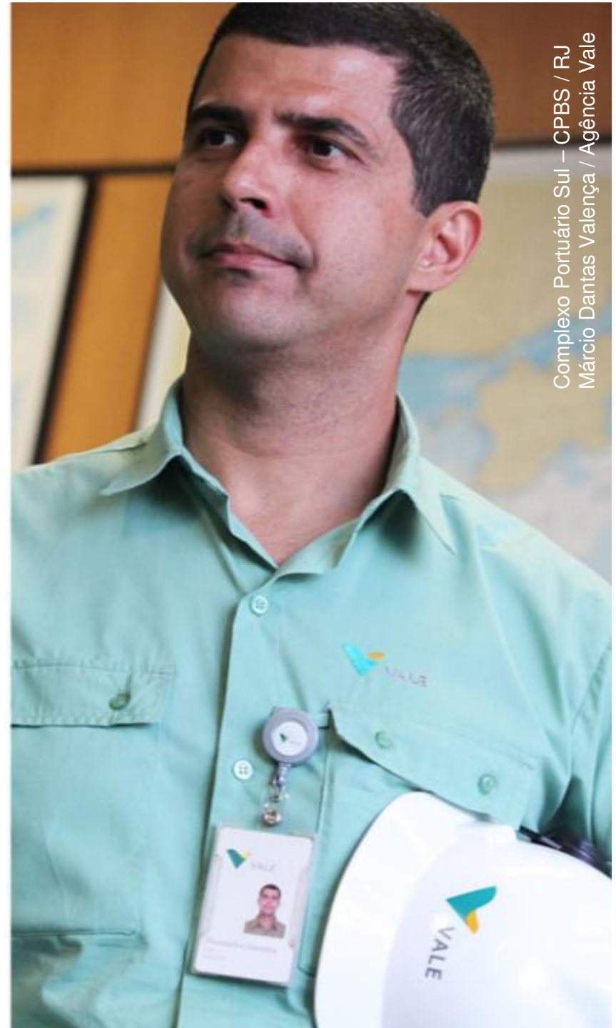
Complexo Portuário Sul – CPBS / RJ

A vida em primeiro lugar Valorizar quem faz a nossa empresa Cuidar do nosso planeta Agir de forma correta Crescer e evoluir juntos Fazer acontecer