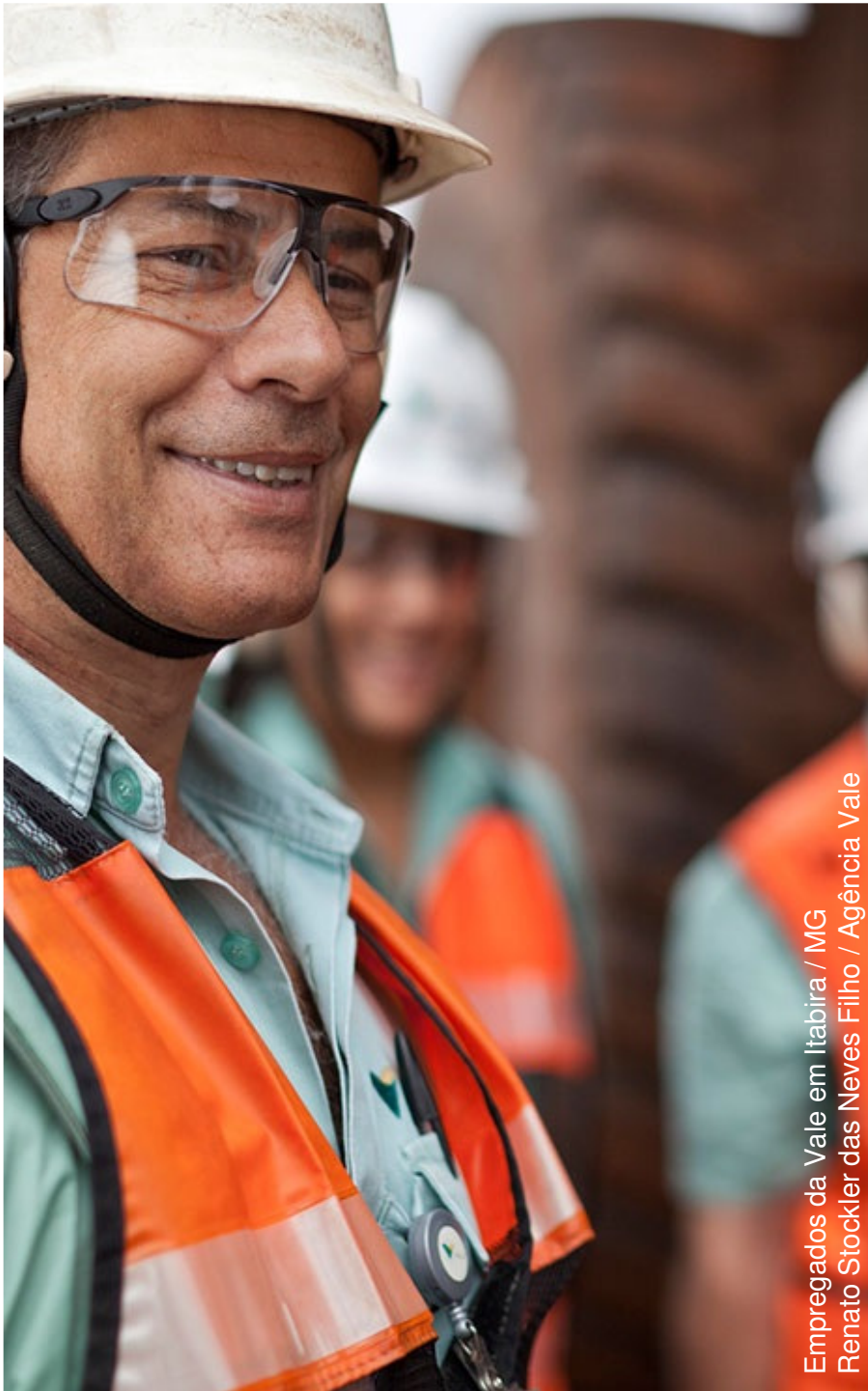
Empregados da Vale em Itabira / MG