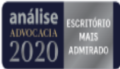
image006.png 7 KB