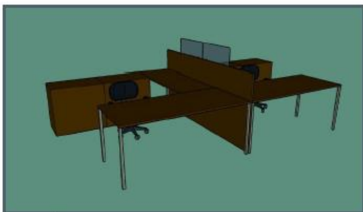
Mesa de gestor

ITEM 01: Placa de acrílico de 4mm com tamanho padrão de 0,69m (L) x 0,255m (H) abaloada nos cantos que poderá ser colocada tanto em cima da divisória das mesas de gestor, quanto em cima do nicho das mesas de staff, quanto dentro dos nichos.