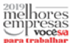
image002.png 7 KB