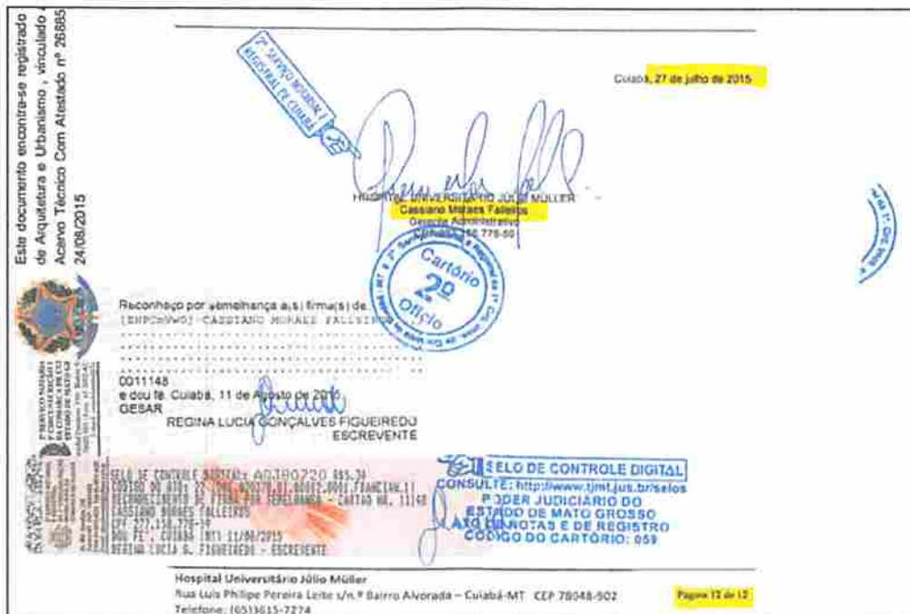
Imagem: Recortes do Atestado apresentado pela empresa GABINETE.

Ora, para que burocratizar o sistema se a economia recomenda o contrário? O CREA/SP facilitou a emissão de CATs, sem perder a qualidade em sua fiscalização.