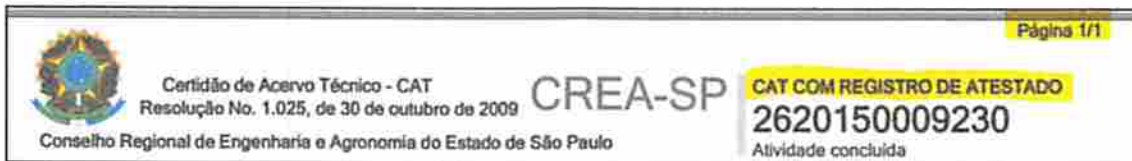
Imagem: Recortes da CAT nº 2620150009230.

Além disto, na CAT verifica-se o termo "CAT COM REGISTRO DE ATESTADO" e que possui "Página 1/1". Obviamente demonstrando que o CREA/SP não anexa o Atestado no documento gerado (CAT) que pode ser autenticado digitalmente.