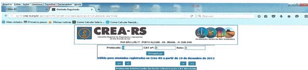
Imagem 3: Site CREA-RS – Aba para consulta de Atestado