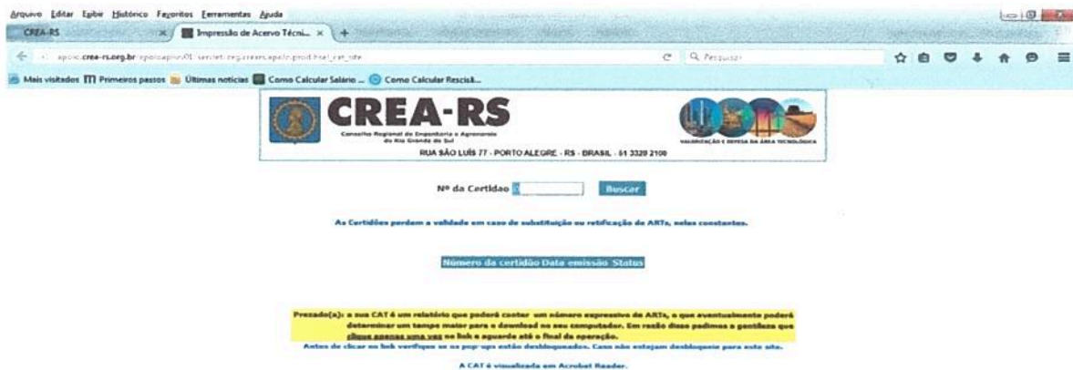
Imagem 2: Site CREA-RS – Aba para consulta de Certidão