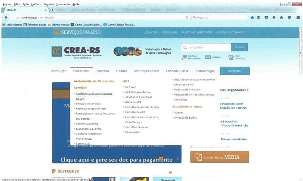
Imagem 1: Site CREA-RS – Aba para consulta de autenticidade de CAT

Em consulta ao CREA-RS, para verificação sobre os procedimentos para conferência da autenticidade dos Atestados registrados antes de 10 de dezembro de 2013 a conferência deve ser realizada no site através das abas - profissional, serviços, conferência de autenticidade da CAT, Nº da certidão - conforme as imagens abaixo: