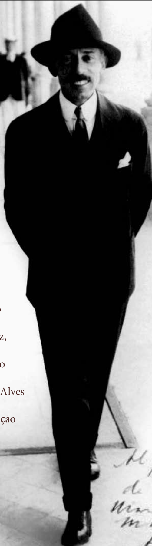
Figura internacionalmente conhecida no início do século XX, Santos Dumont é um dos verbetes do novo dicionário, ao lado do médico Oswaldo Cruz, que convenceu o então presidente Rodrigues Alves a vacinar toda população do Rio de Janeiro

Honor Al procurador de la causa Nim del Plant Marzo 21/19 FRTCover