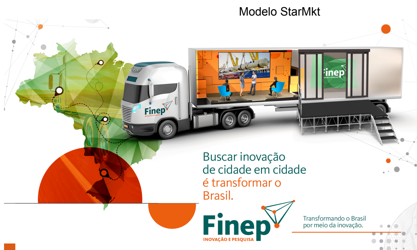
FIGURA 03 - CONCEITO FINEP TRUCK

O Fineptruck é um projeto inovador que combina mobilidade, tecnologia e comunicação para ampliar a presença da Finep em todas as regiões do Brasil. Mais do que um caminhão, ele será um mini-laboratório itinerante, equipado para apresentar projetos, fechar negócios, fomentar novas ideias e conectar a Finep com comunidades, startups, universidades e empresas.