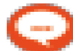
image004.png 837 B