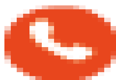
image002.png 585 B